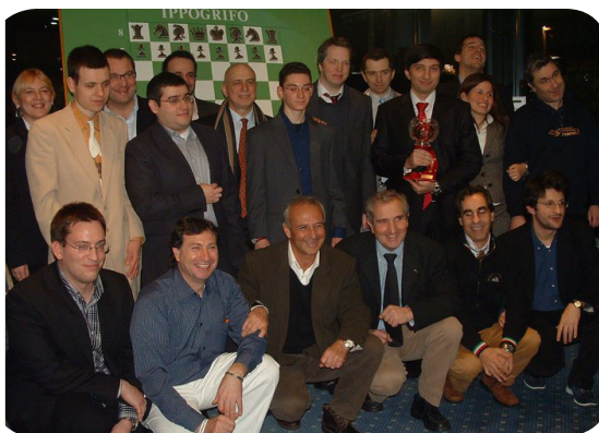
Foto di gruppo della 53a edizione del Torneo di Capodanno organizzatori, Presidentissimo, giocatori e arbitri.

Bollettini e partite su www.ippogrifoscacchi.it