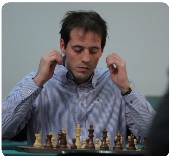
Il disappunto di Paco che si fa raggiungere in vetta alla classifica dal combattivo Gashimov.