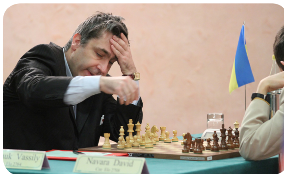
Ivanchuk sembra già disperarsi, presago delle proprie malfatte nella partita contro Navara